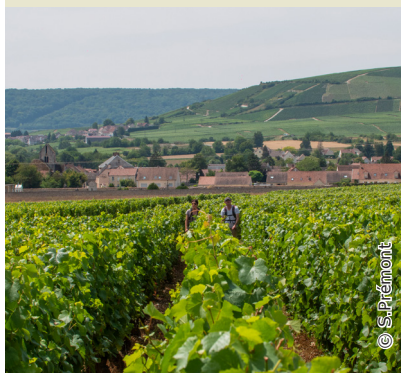
En chemin dans les vignes de Trélou